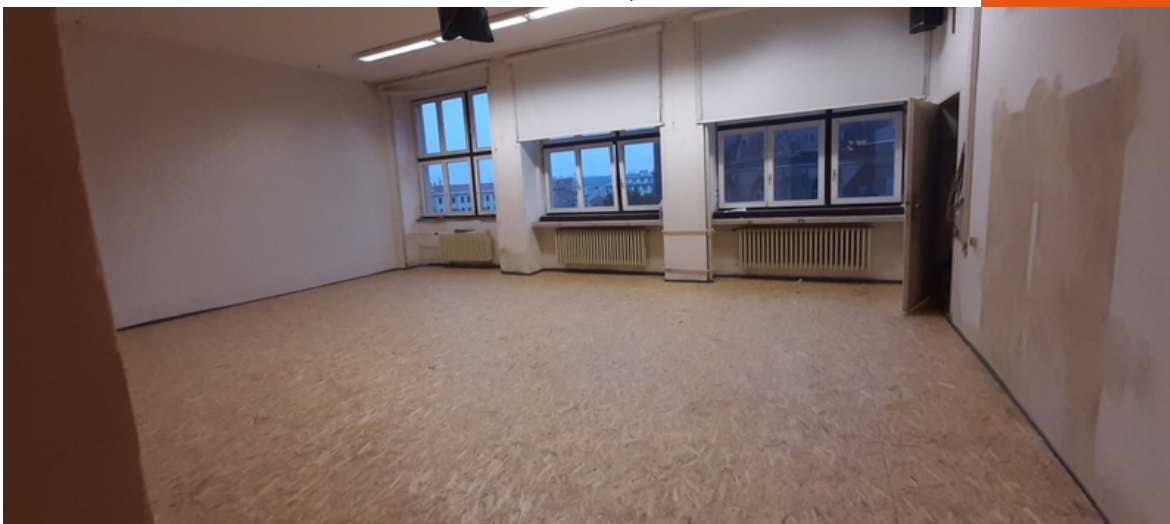
28. 8. zbývá už jen stěrka a lino - a školní rok může začít!