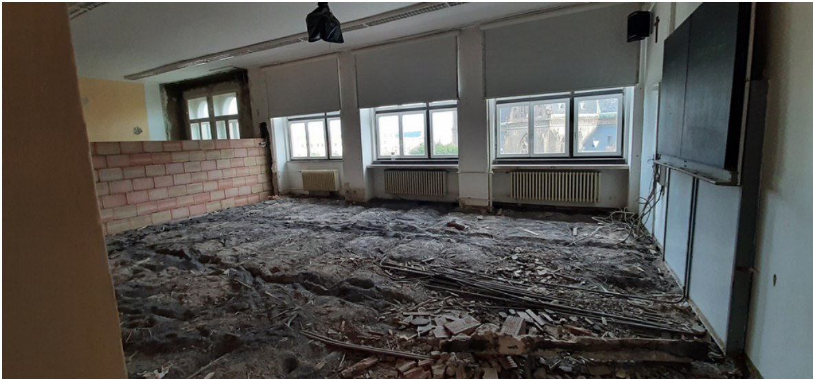
Podlaha odstraněna, staví se zeď