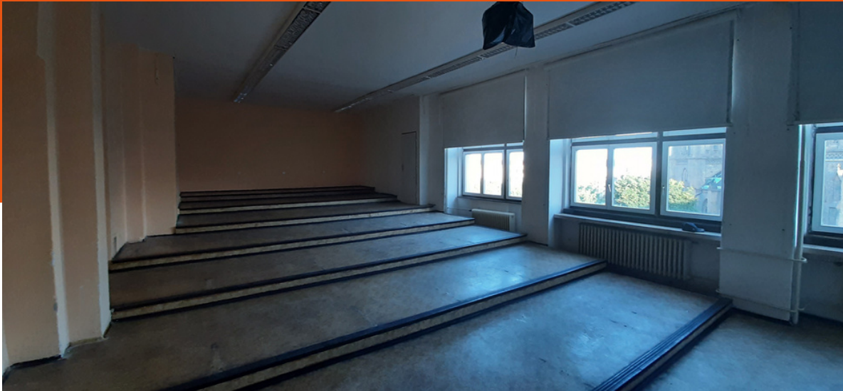
311 připravena k sejmutí stupňovité podlahy

Přes prázdniny proběhly na AG stavební práce, sestávající především z posunu stěny mezi AG a KDM v učebnách 109 a 311 tak, aby byla zeď ve všech patrech na hraně budov AG a KDM. Ve škole také byla umyta okna a vymalována většina prostor; byly odstraněny staré koberce a nahrazeny linoleem; ze všech tříd byly odstraněny staré žaluzie.